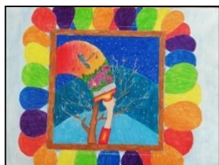
Il classificati a pari merito - Giorgia Cassé III A e Dimitri Campari III B